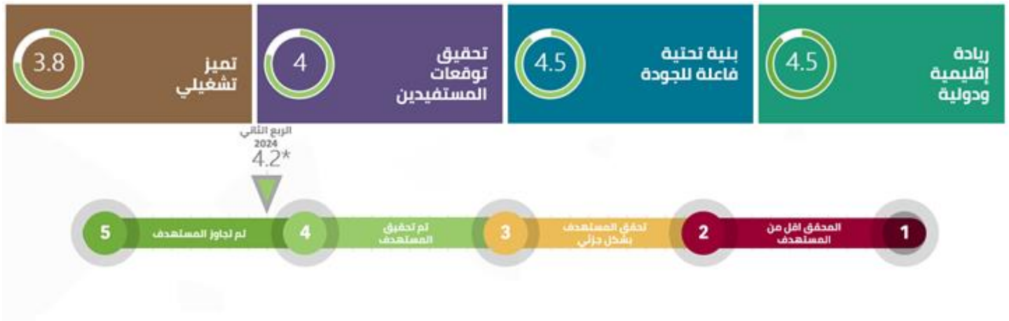
شكل رقم (3): معدل الإنجاز في الأداء الاستراتيجي خلال فترة التقرير

حققت الهيئة تميزاً في الأداء العام للاستراتيجية خلال فترة النصف الأول لعام 2024م، إذ بلغت نسبة الإنجاز في الأداء الاستراتيجي (4.2) من (5)، تحققت فيها جميع المؤشرات الاستراتيجية البالغ عددها (29) مؤشراً، حيث تحققت منها بشكل كامل (23) مؤشراً استراتيجياً، حققت (4) مؤشرات جزئياً. وبلغت المؤشرات المرتبطة باستراتيجية الهيئة (23) مؤشراً، والمرتبطة بالرؤية (6) مؤشرات تضمّنها تقرير المركز الوطني لقياس أداء الأجهزة العامة "أداء". ويوضح الشكل رقم (3) معدل الإنجاز في الأداء الاستراتيجي لاستراتيجية الهيئة خلال فترة التقرير، وفقاً لكل ركيزة استراتيجية.